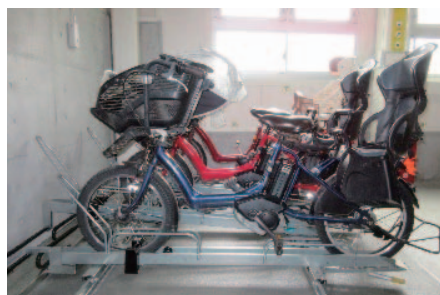
大型車対応電磁ロック付 スライドラック