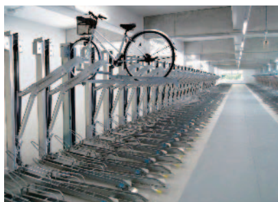
垂直昇降式サイクルラック