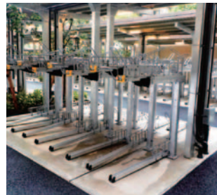
アルミ2段固定ラック

実際に商品をご覧いただくショールーム（横浜営業所内）もございます。お気軽にお問合せください。