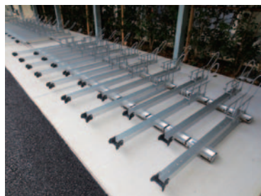
アルミスライドラック (35kg対応)

従来のアルミ素材の滑らかな動きに加え、多様化する自転車に合わせて重量35kgに対応し、より良い‘つかいごこち’を追求した駐輪機になります。