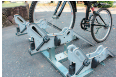
自転車ロック装置 UT-1800

駐輪場向け製品として、施設の利用目的や設置環境に合わせた各種の機器・システムや、運営をサポートするサービスを提供しています。