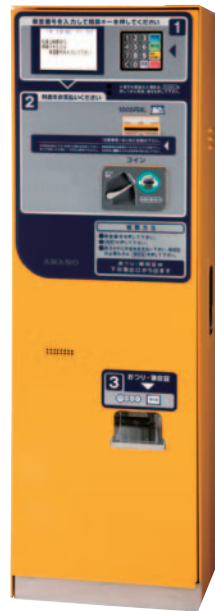
ロック式集中精算機 UT-4000