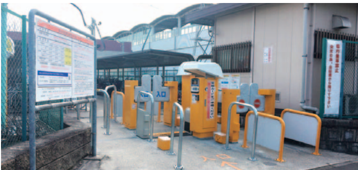
ゲート式システム UT-1500ほか