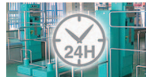
場内場外清掃管理・人材管理・集金運営管理・夜間管理・24時間対応サービス