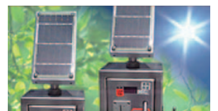
無電源(太陽電池)サンラッキー