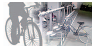
機械式駐輪設備(ゲートシステム・駐輪場管理システム・各種サイクルラック設置・販売)