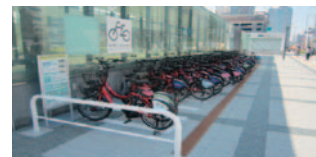
区画ゴムチップライン(トッキーライン)