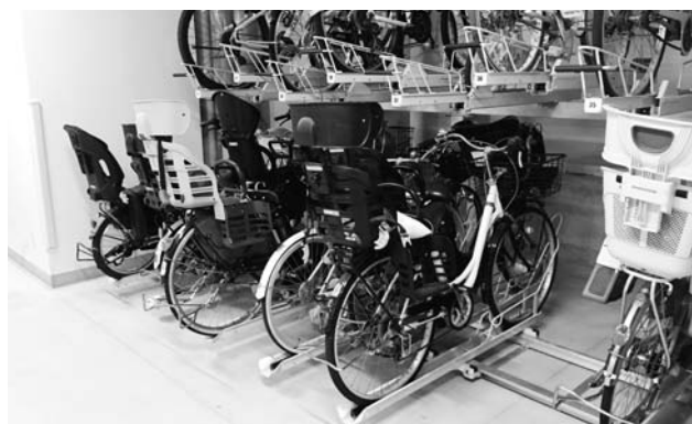
2段式スライドラック下段3人乗り対応MCY-GU/S4型