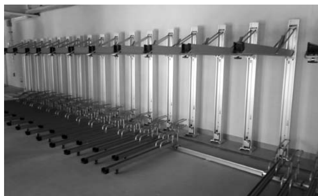
垂直2段式ラックMCY-GF/SF型