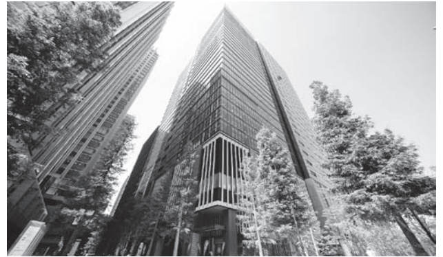
大手町フィナンシャルシティ グランキューブ (3基716台) ビル組込み 地下水平型