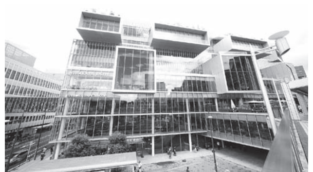
枚方T-SITE (1基224台) ビル組込み 屋上格納型