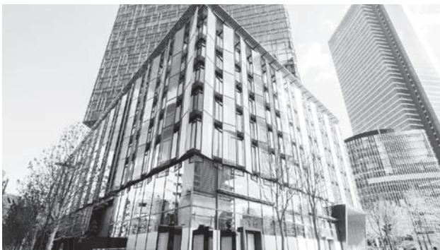
大名古屋ビルディング (4基952台) ビル組込み 地下円筒型