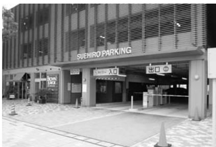
桑名市営自動車駐車場