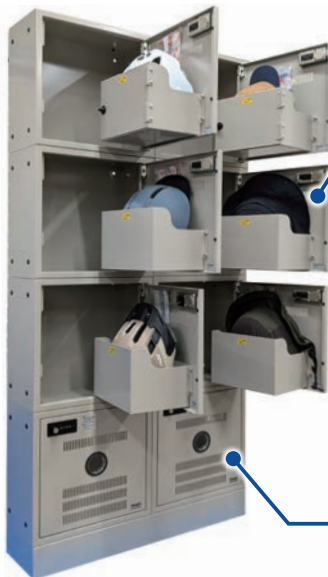
2025秋 自転車利用環境向上会議に出展 2×4 8ユニット

○ 弊社は自転車ヘルメット用のロッカーを、内外電機株式会社と共同で開発しました。