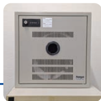
単体で、壁掛け設置も可能 サイズ：幅400×高さ400 ×奥行200(mm)

令和6年4月1日の道路法改正で、自転車利用者にヘルメット着用が努力義務化されました。