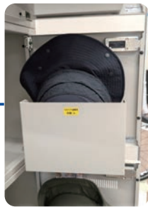
大きなヘルメットも収納可能