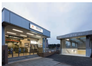
南町田駅地下自転車駐車場