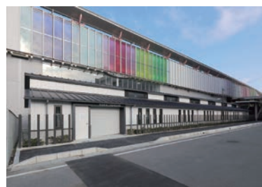
JR奈良駅東口自転車駐車場