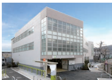
高尾駅北口自転車駐車場

今後とも、良質な自転車駐車場の整備を中心に、多様なモビリティに対応する安全で快適な自転車等利用空間を創出し、環境と調和した人間中心の社会の発展に貢献していく所存です。