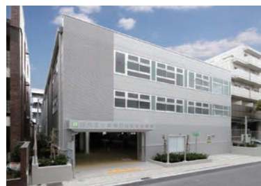
西八王子駅南口自転車駐車場