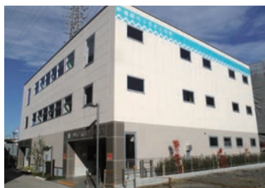
甲州街道北第2自転車駐車場