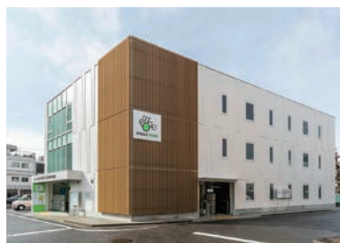
JR高蔵寺駅北口自転車駐車場