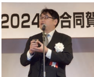
【乾杯挨拶】 日本シェアサイクル協会 工藤 智彰 副会長